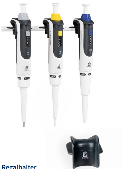
Regalhalter für 1 Transferpette® S Ein- oder Mehrkanalpipette.

Mit den Haltern und Ständern sind die Geräte immer fachgerecht aufbewahrt und griffbereit für den nächsten Einsatz.