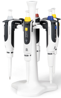
Abb. Pipetten-Paket 2