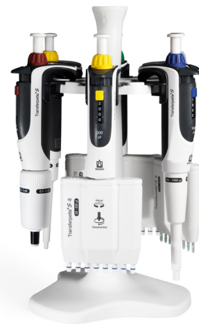
Tischständer Tischständer für 6 Transferpette® S Ein- oder Mehrkanalpipetten.