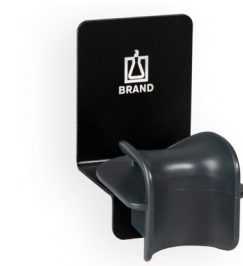
Wandhalter für 1 Transferpette® S Ein- oder Mehrkanalpipette.