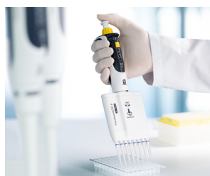
Arbeiten mit PCR-Platten